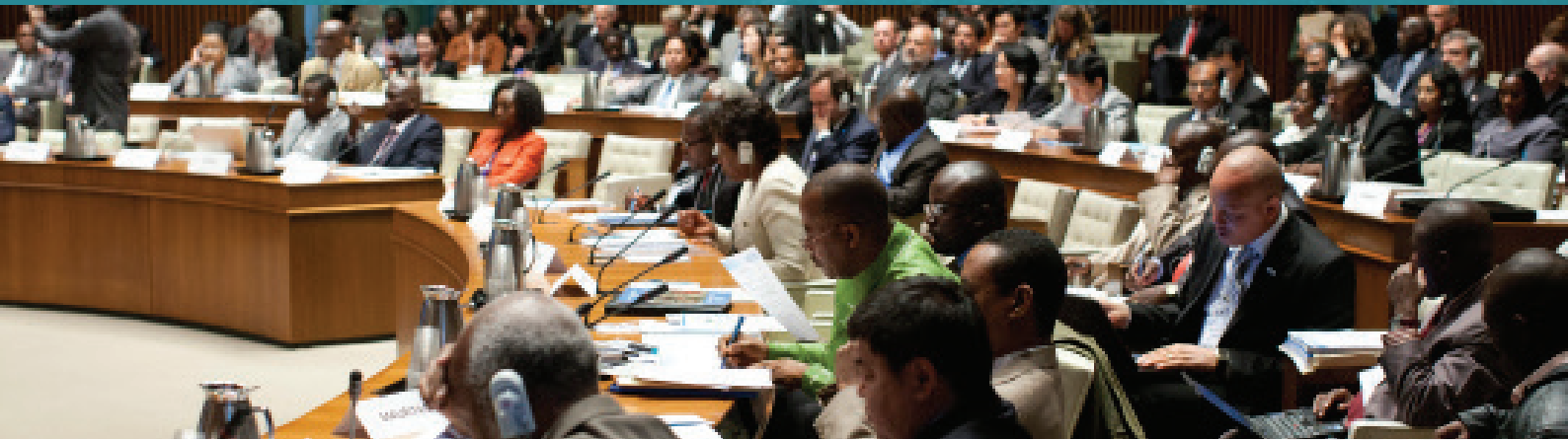
Kristoffer Tripplary / SWA

au développement réunis pour œuvrer à un accès universel à une eau propre et à un assainissement suffisant. Les partenaires du SWA coopèrent pour susciter l'action à haut niveau, améliorer la transparence et utiliser plus efficacement les ressources réduites.